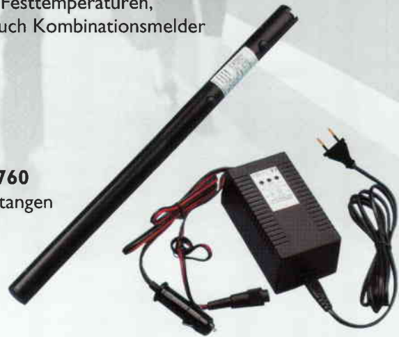
Solo 725 Schnellladegerät