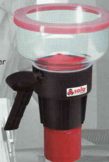
Solo 332 Aerosol Spender

Der Solo 332 steht zur Prüfung größerer Melder zur Verfügung.