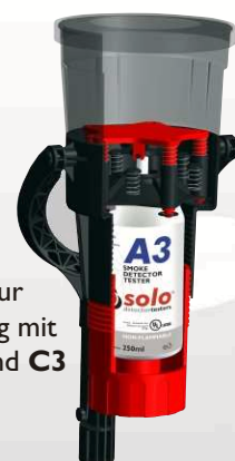
Solo 330 zur Verwendung mit Solo A3 und C3 Aerosolen

Der Solo 332 steht zur Prüfung größerer Melder zur Verfügung.