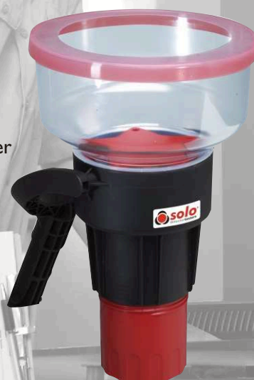
Solo 332 Aerosol Spender