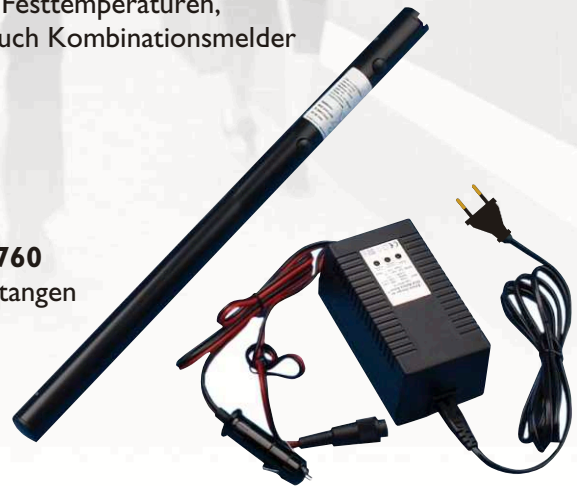
Solo 725 Schnellladegerät